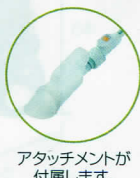
アタッチメントが付属します。