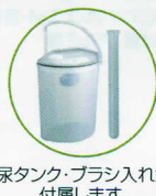
尿タンク・ブラシ入れが付属します。