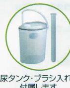
尿タンク・ブラシ入れが付属します。

※価格について…総額表示義務の特措法案に基づき本体価格(税抜き定価)+税表示となっております。