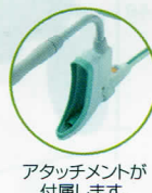
アタッチメントが付属します。