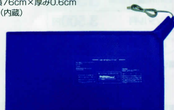
マットレスパッドワイド

【マットレスパッドワイド】■縦38cm×横76cm×厚み0.6cm 【送信機】単3形ニッケル水素充電電池パック(内蔵) またはACアダプター(付属) 【受信機】単4形ニッケル水素充電電池(付属) またはACアダプター(付属)